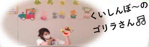
くいしんぼ〜の ゴリラさん🎵