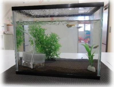
メダカさんもいるよ~