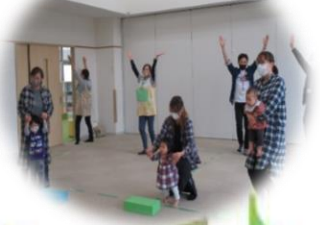
ラストはみんなで ダンス! ダンス!