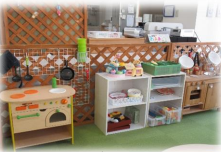
ままごとコーナー