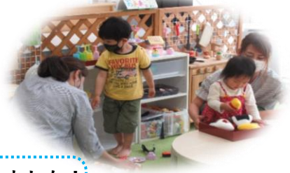
乳幼児親子さんも遊びにきてくれました! また遊ぼうね🎵